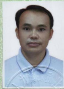
(加盖批准机关钢印有效) Valid with embossed seal