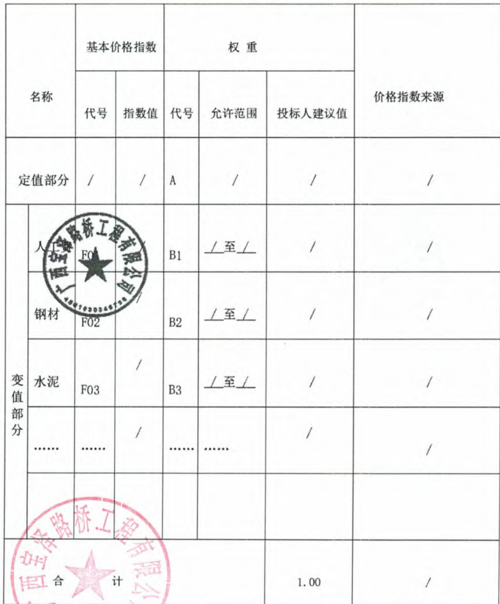
价格指数和权重表