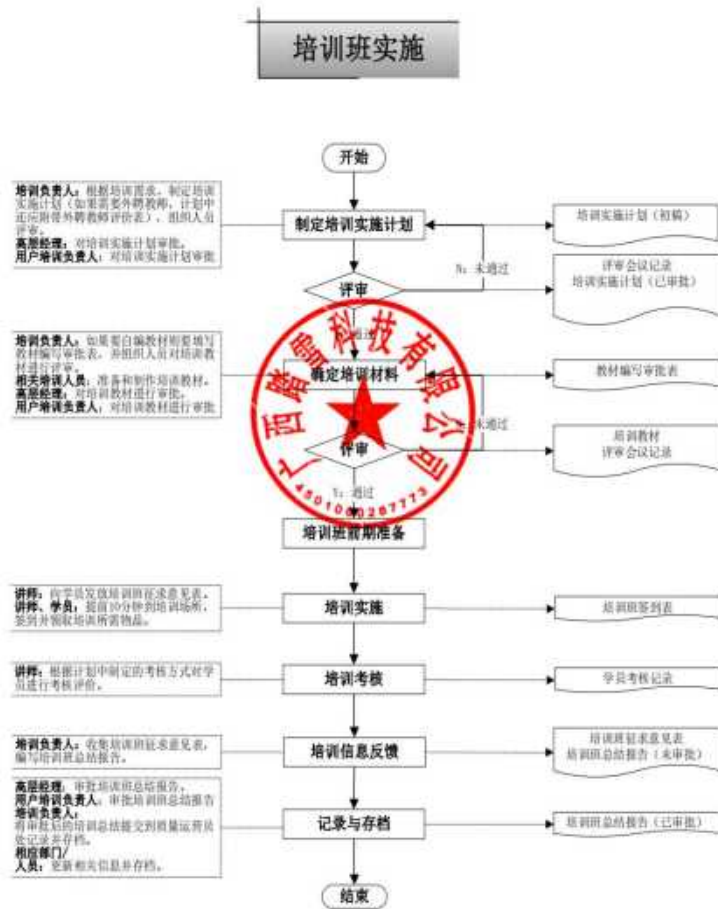
附件：培训实施流程图