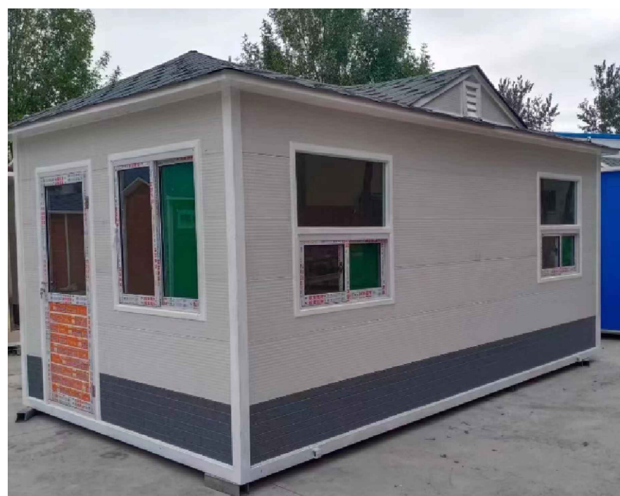
入口管理房意向图