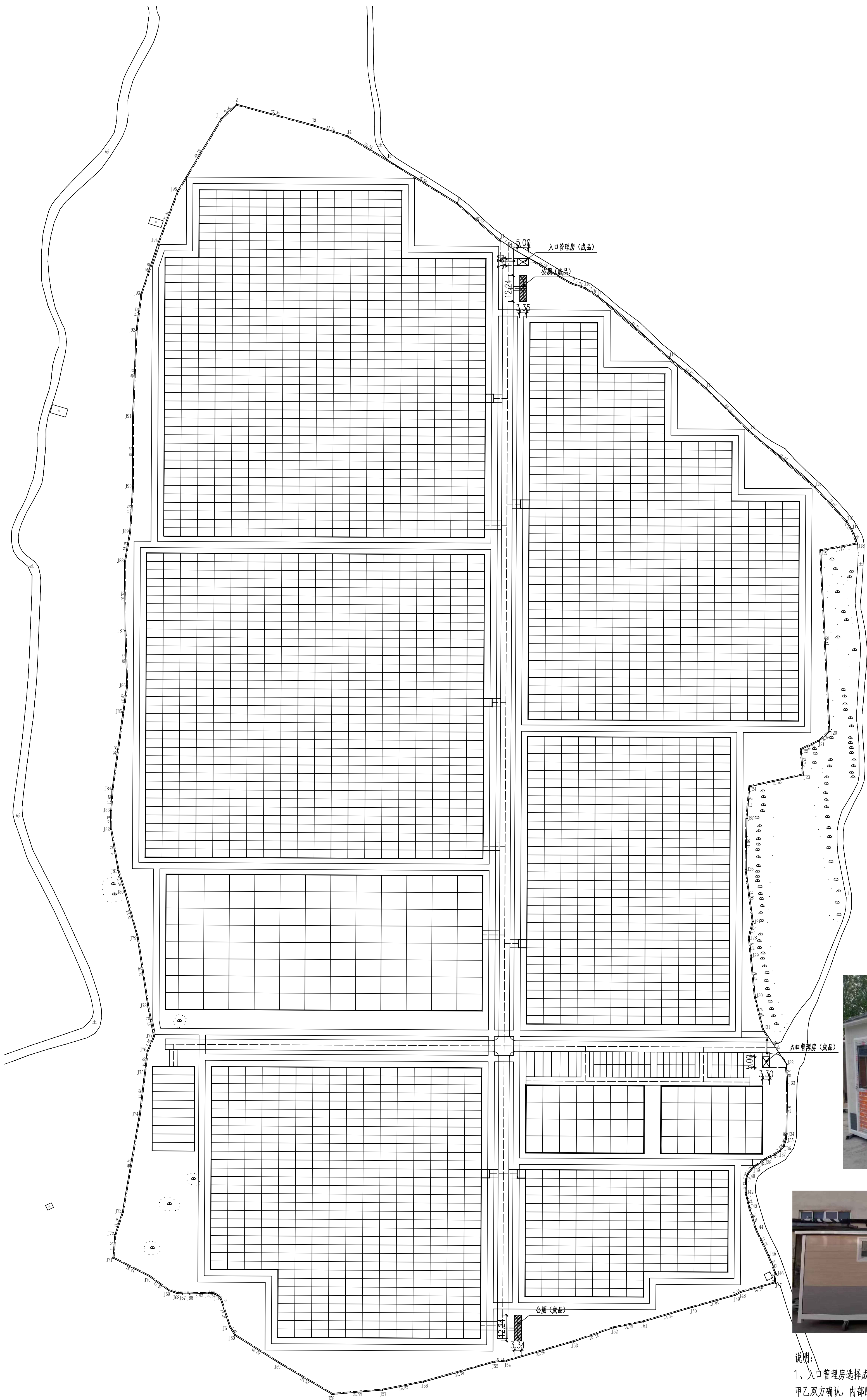
入口管理房、公厕布置图 1:1