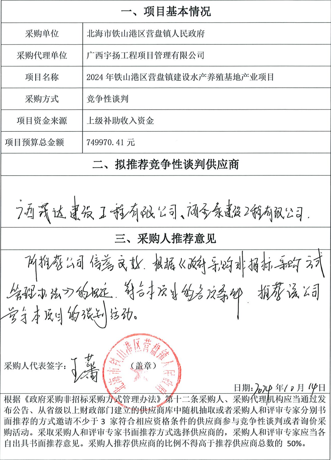
政府采购项目竞争性谈判邀请单位采购人推荐意见表