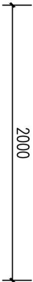
竹篱笆标准大样图 1:100