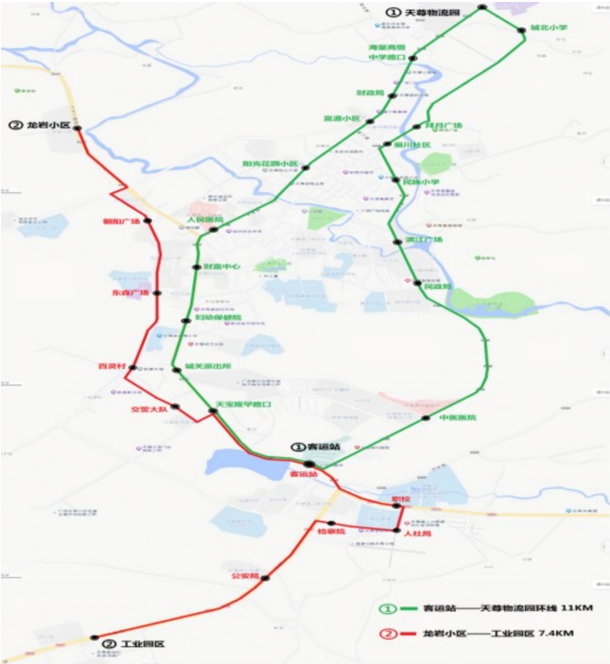
城区公交优化线路图