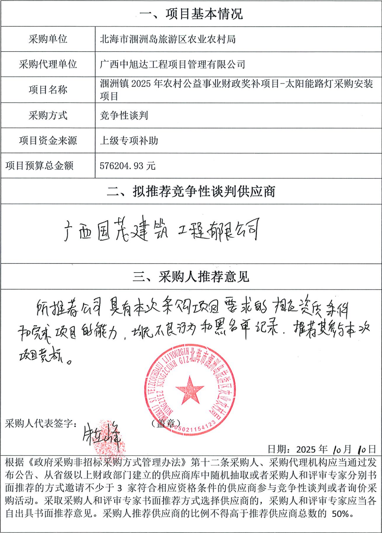
政府采购项目竞争性谈判邀请单位采购人推荐意见表