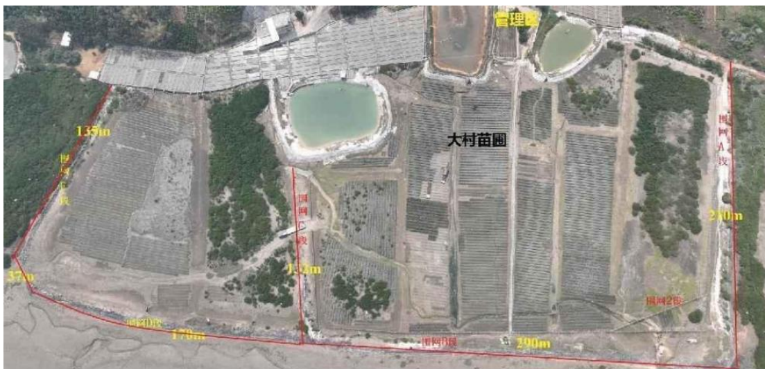
图 1.4 造林地红线及防护围网示意图