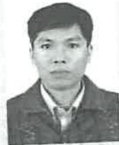
(加盖批准机关钢印有效) Valid with embossed seal