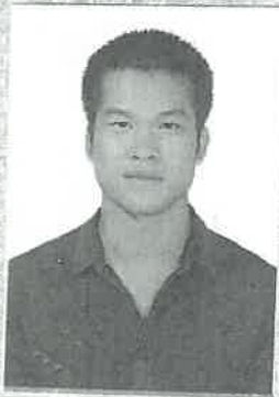
(加盖批准机关钢印有效)