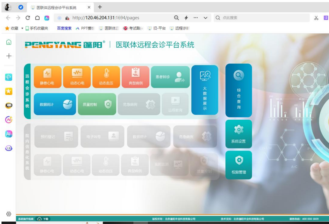
三合一平台，静态心电转分析端截图