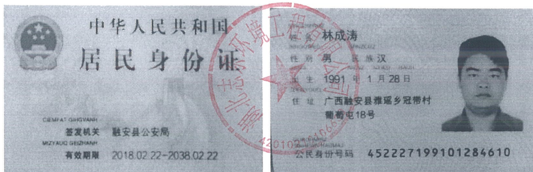
委托代理人有效身份证正反面复印件