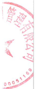
附件 2: 邮寄送达签收底单