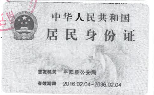
法定代表人身份证正反面复印件粘贴处