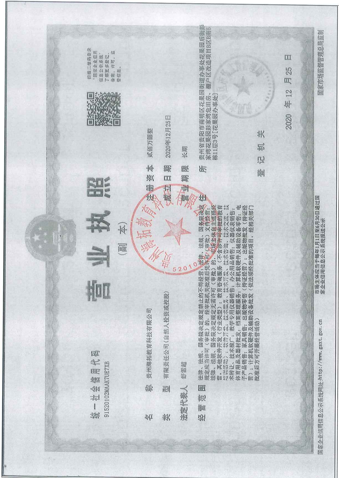
附 1：营业执照复印件