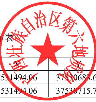
表 1 拟出让采矿权范围拐点坐标表